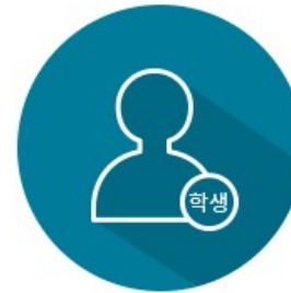
학생회원 (학부생에 한함)